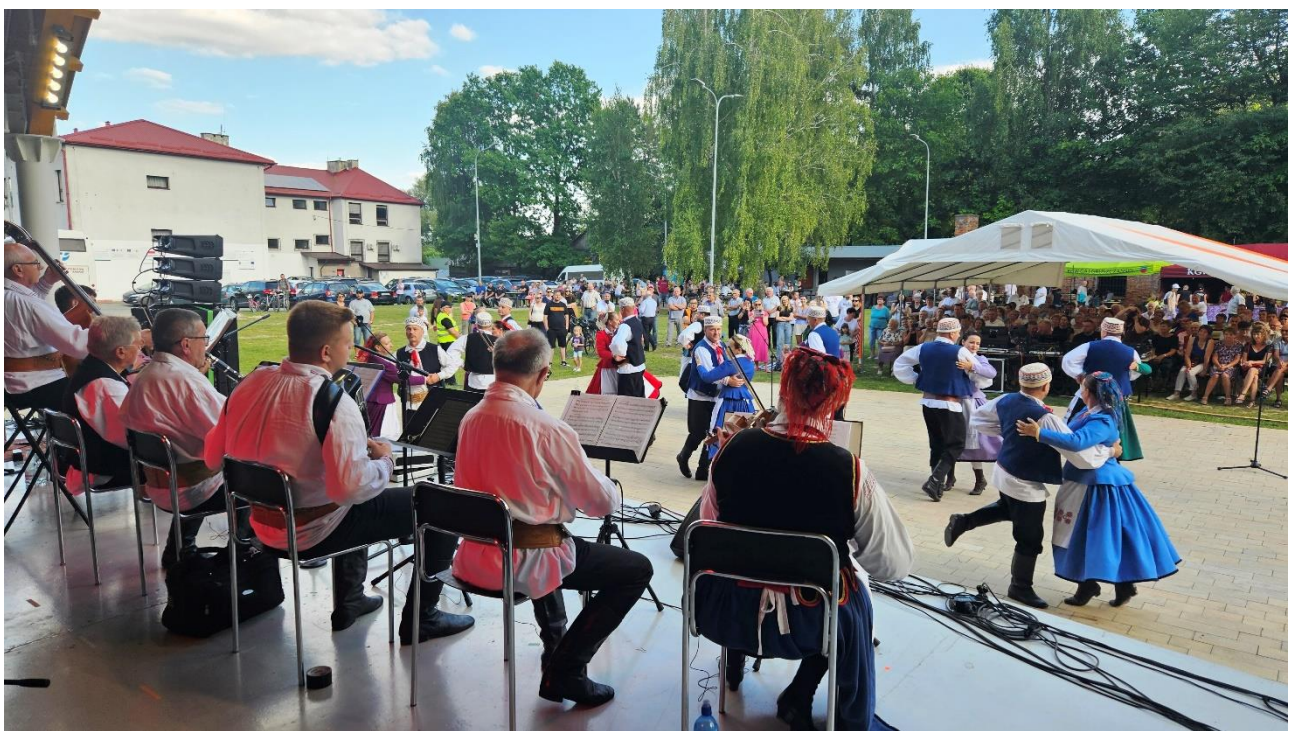
Wydarzenie w Radeczniczy: Na styku kultur