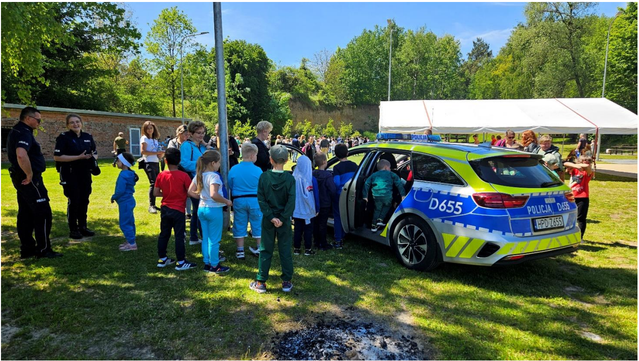
Gminna Olimpiada Radości z okazji Dnia Dziecka