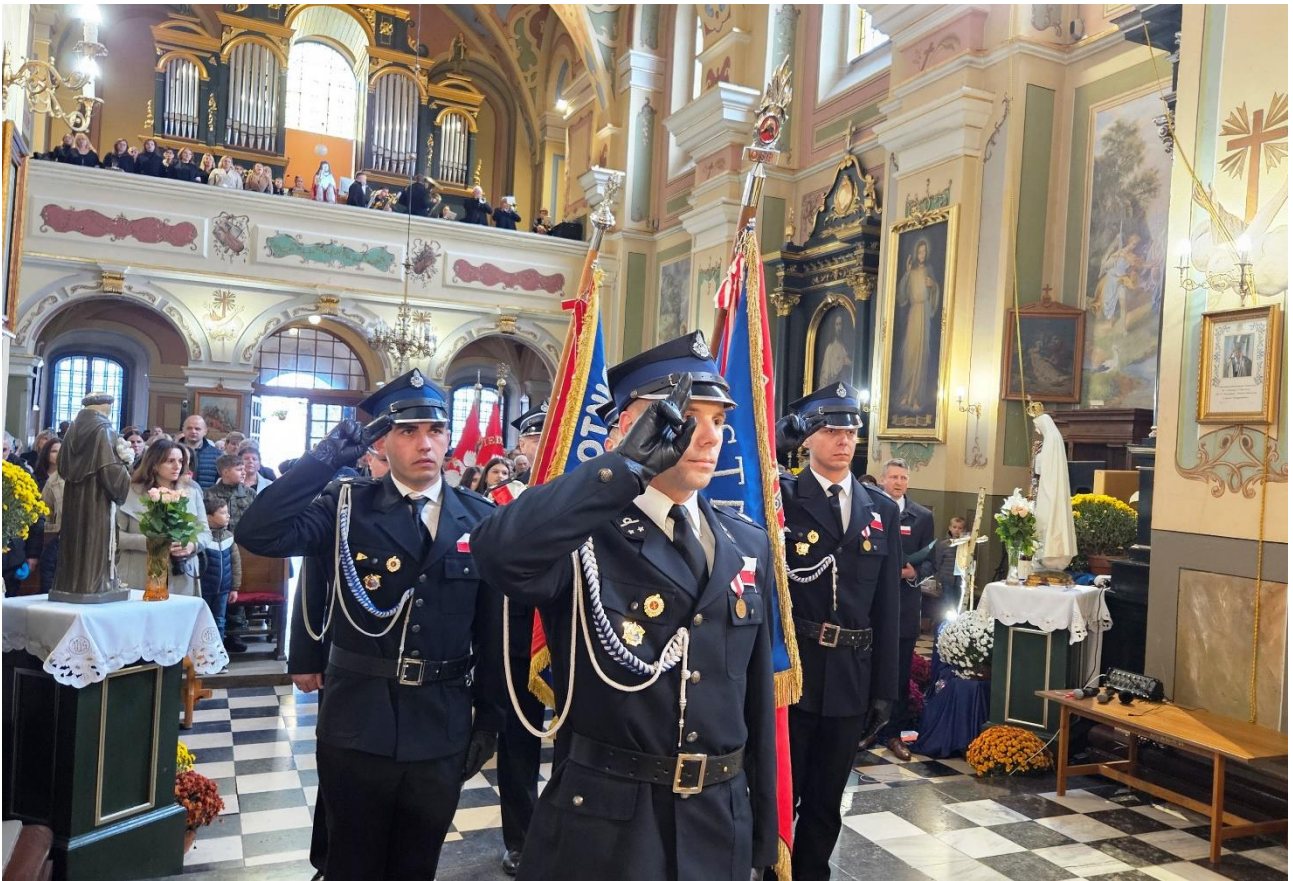
Obchody Narodowego Święta Niepodległości