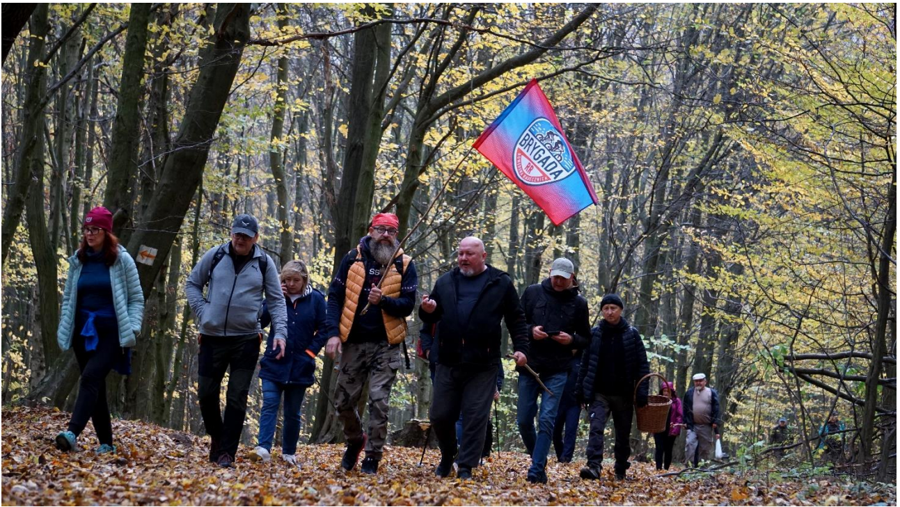
Rajd pieszy połączony z grzybobraniem