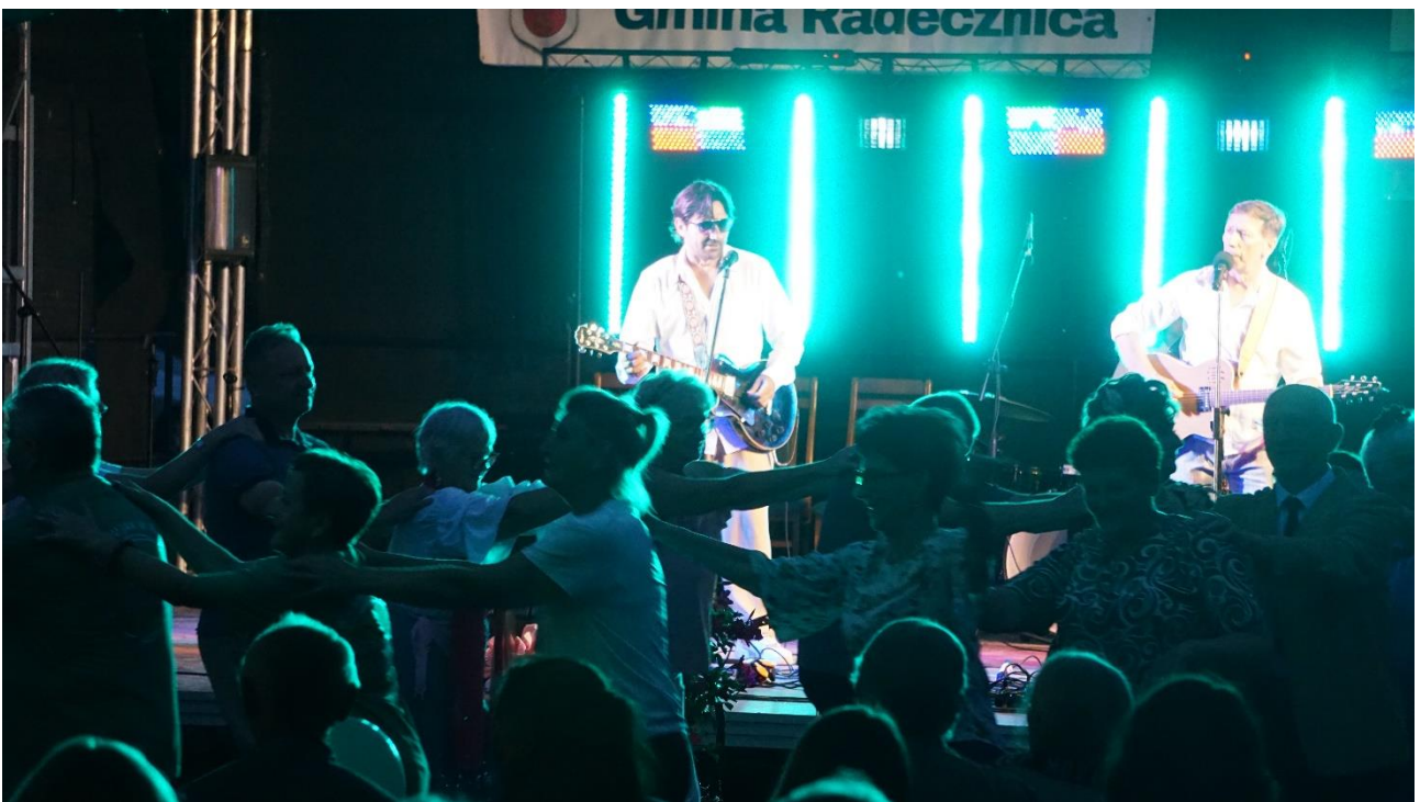
Wakacje w rytmie zdrowia" Piknik Rodzinny w Gaju Gruszczańskim