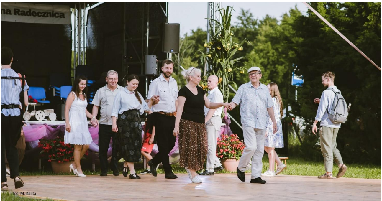
Na sportowo i wesolo