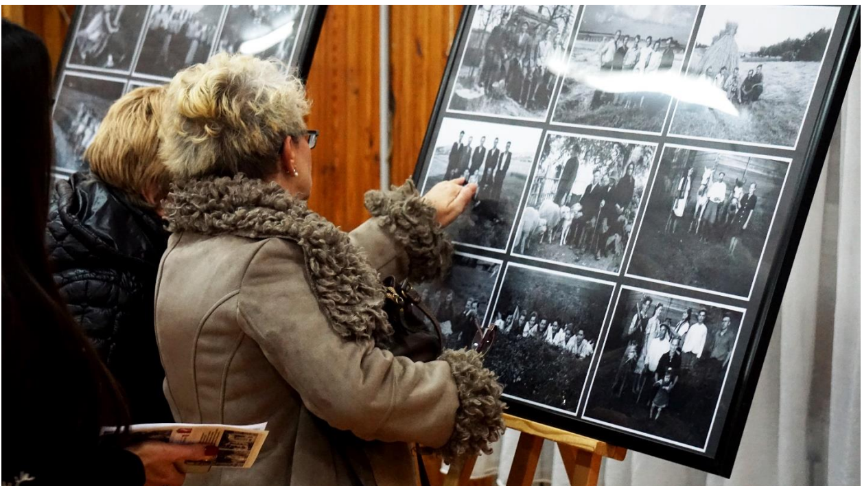
Wernisaż wystawy fotografii autorstwa Józefa Oleszka z Latyczyna „Życie społeczne Gminy Radecznica w latach 1948–1960”