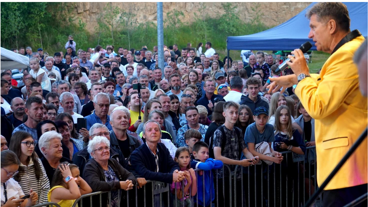
V edycja Festiwalu Antoniańskiego