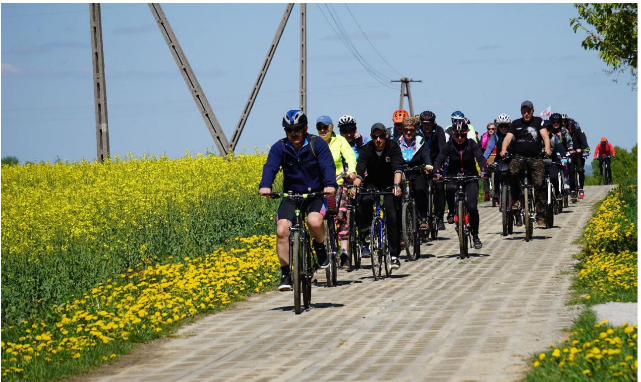
Rajd Rowerowy po Roztoczu Zachodnim w dniu 17.04.2025 r.