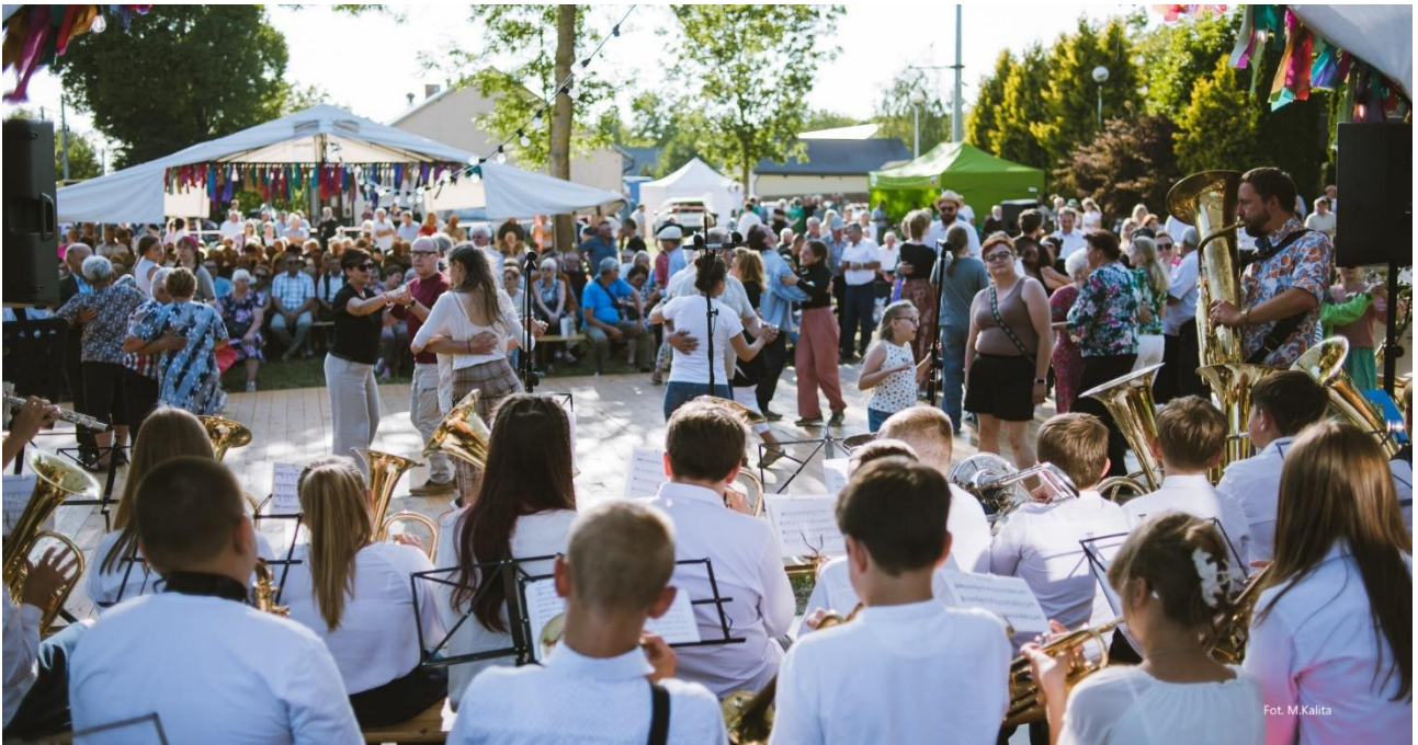
Festiwal Roztrqb w Zakłodziu