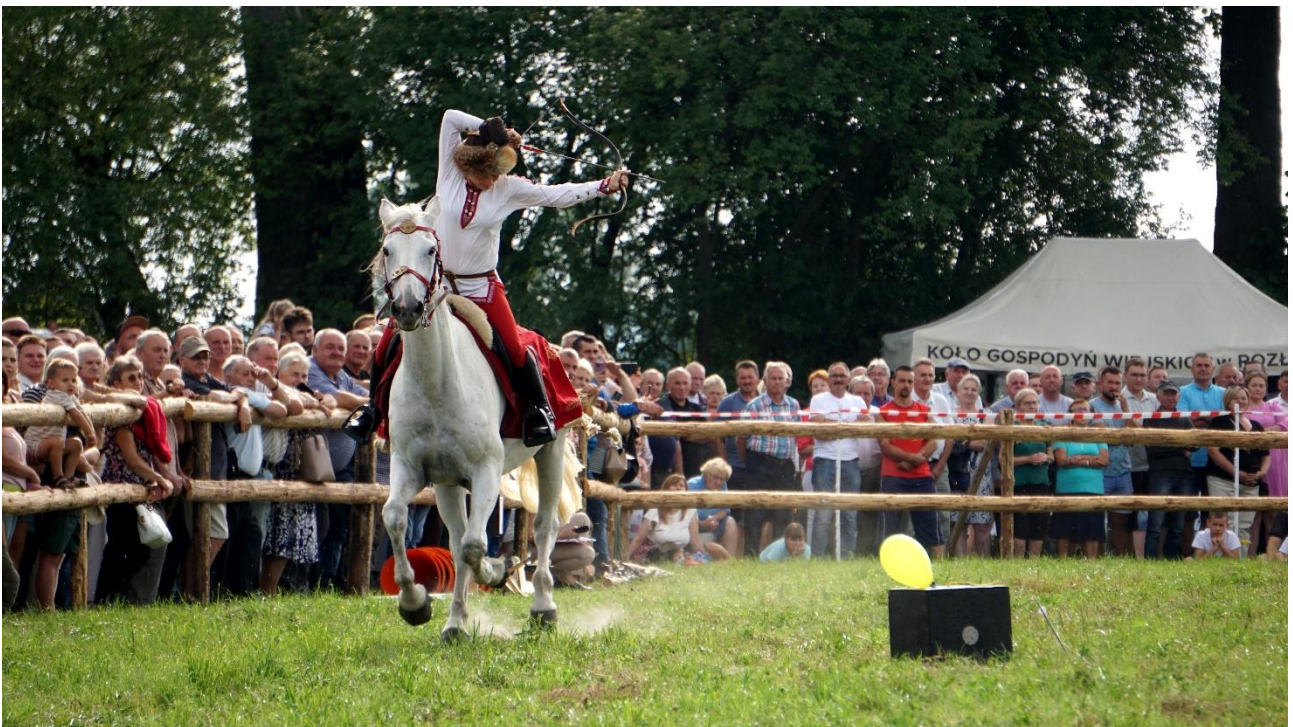
XXI Złot Zaprzęgów Konnych