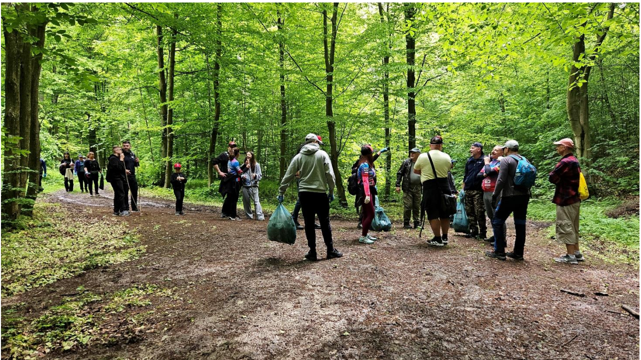
Rajd Pieszy „Razem dla natury”