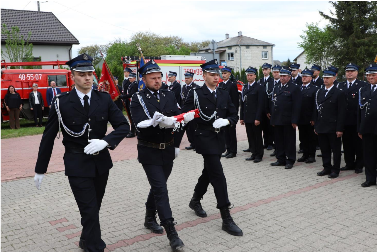
Obchody Gminnego Święta Strażaków w Gorajcu - Zagroble