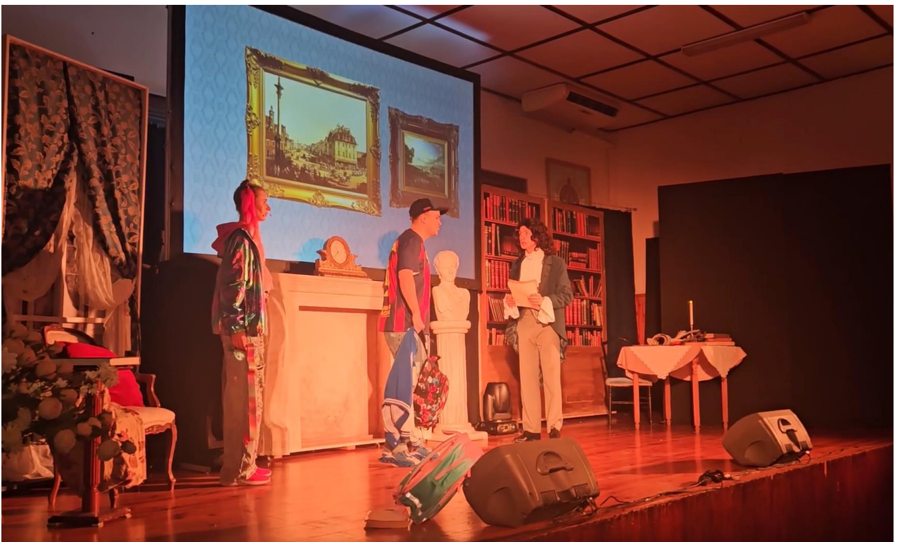
Spektakl muzyczny „Frycek i czerwone serduszko”