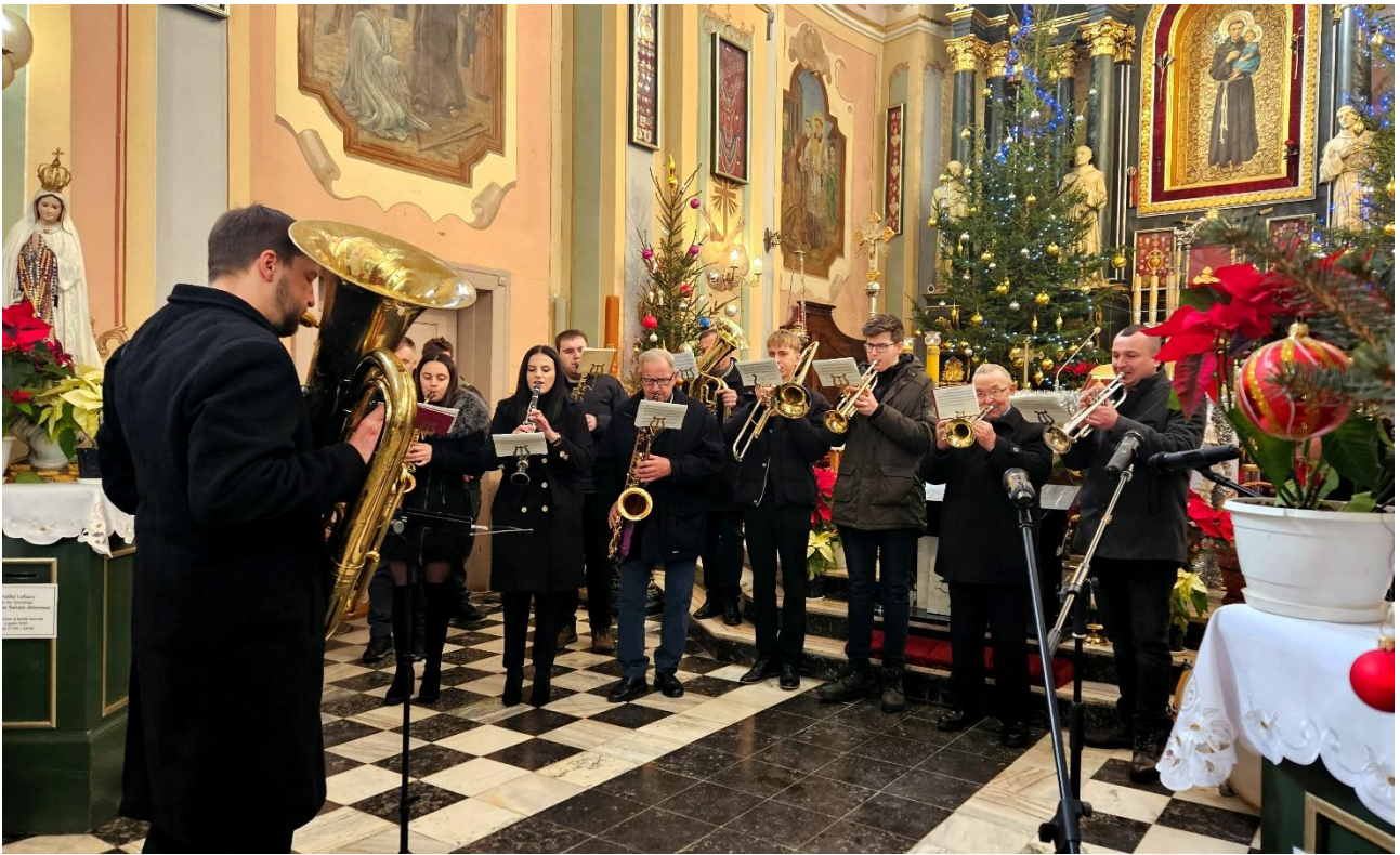
Występ Orkiestry Dętej Zaborze w Bazylice Świętego Antoniego w Radecznicy podczas Wspólnego Kolędowania w dniu 6.01.2025 r.