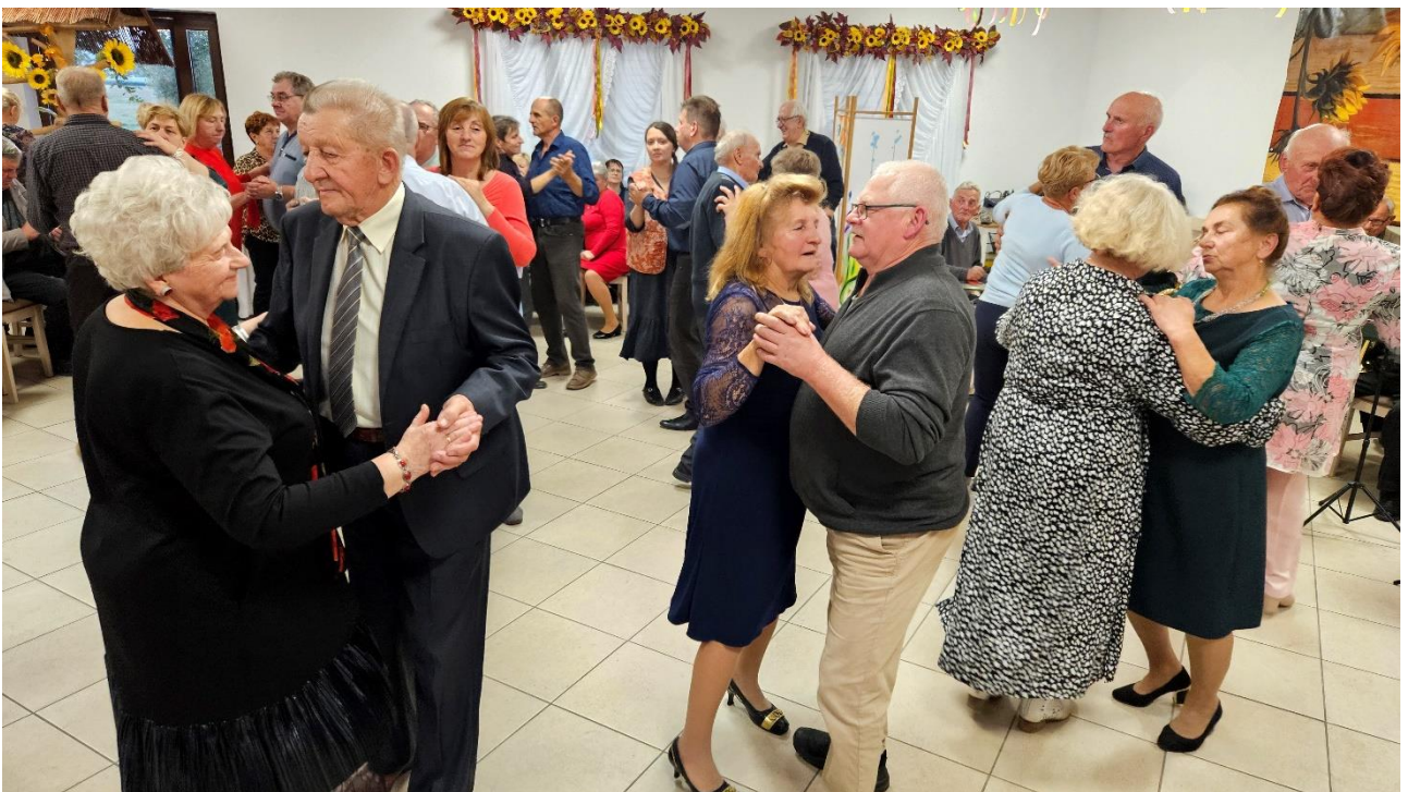
Potańcówka "Jak za dawnych lat" w Dzielcach