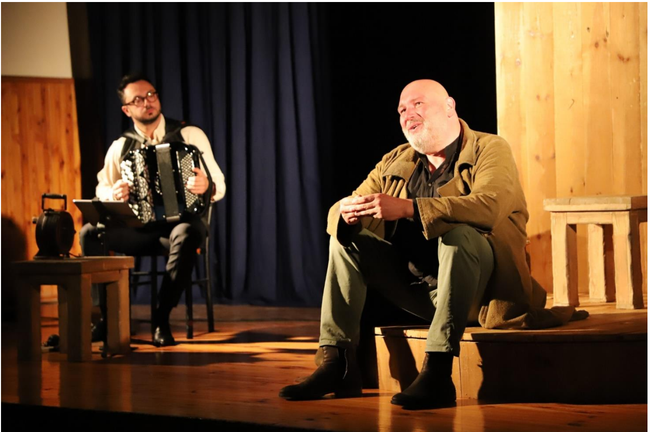
Dzień z Niedźwiedziem Wojtkiem