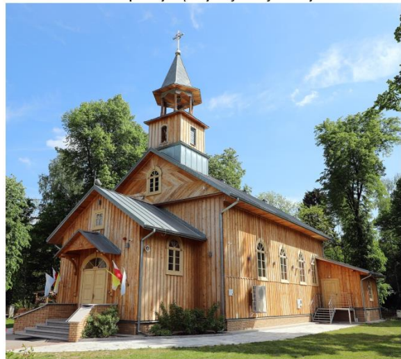
Kościół pw. Świętego Jana Chrzciciela w Trzęsinach