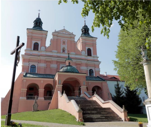
Bazylika pw. Świętego Antoniego w Radecznicy