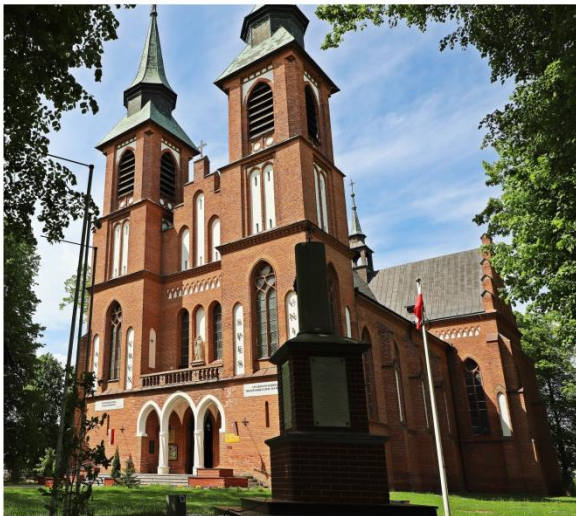
Kościół pw. Znalezienia Krzyża Świętego w Mokremłipiu