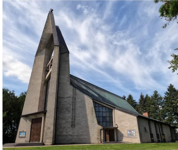
Kościół pw. Najświętszej Maryi Panny w Gorajcu