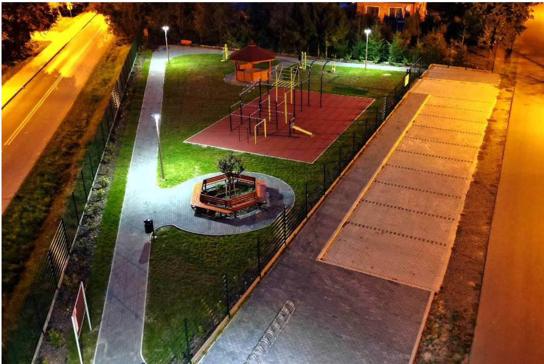
Siłownia plenerowa przy Szkole Podstawowej w Zaburzu