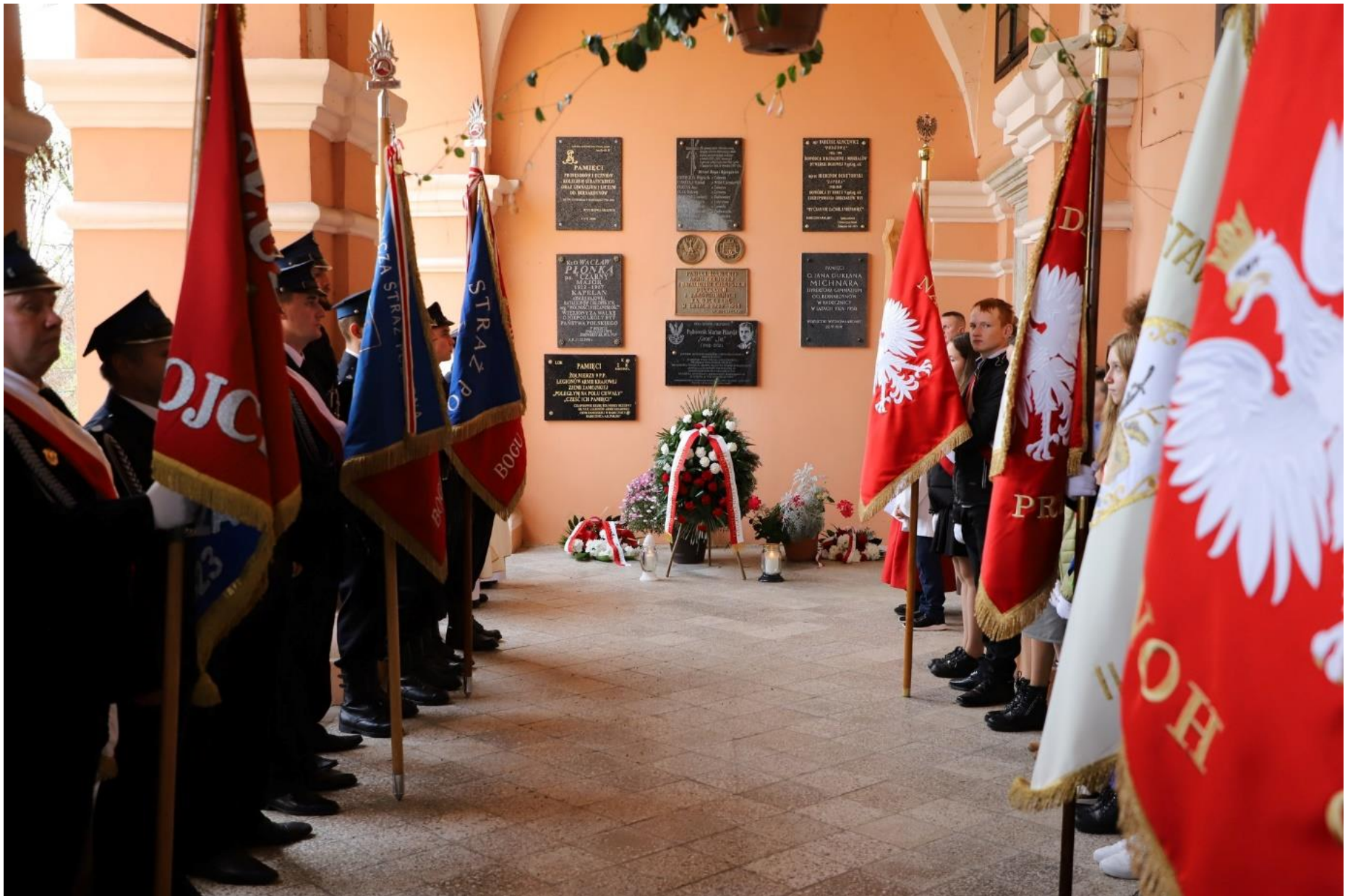
Narodowe Święto Niepodległości Radecznicza-Zakłodzie