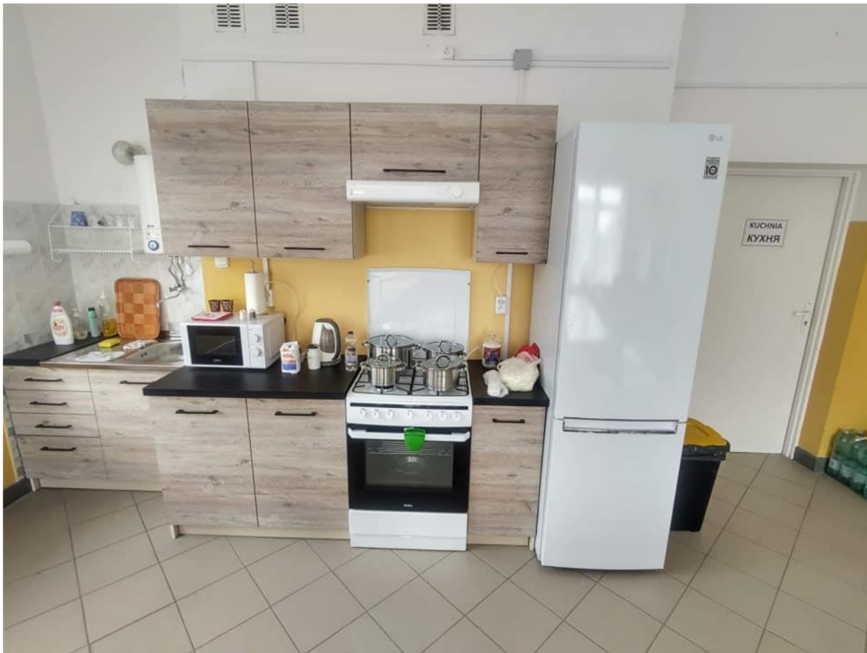
Пункт заkwaterowania dla Uchodźców z Ukrainy przy ul. B. Prusa 65A w Radeczniczy