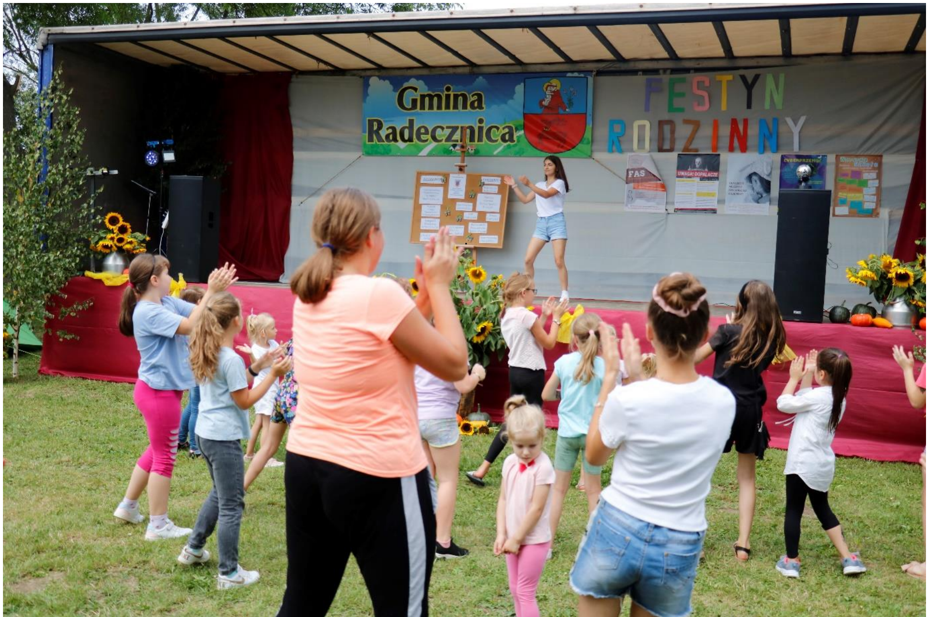
Festyn Rodzinny w Czarnymstoku