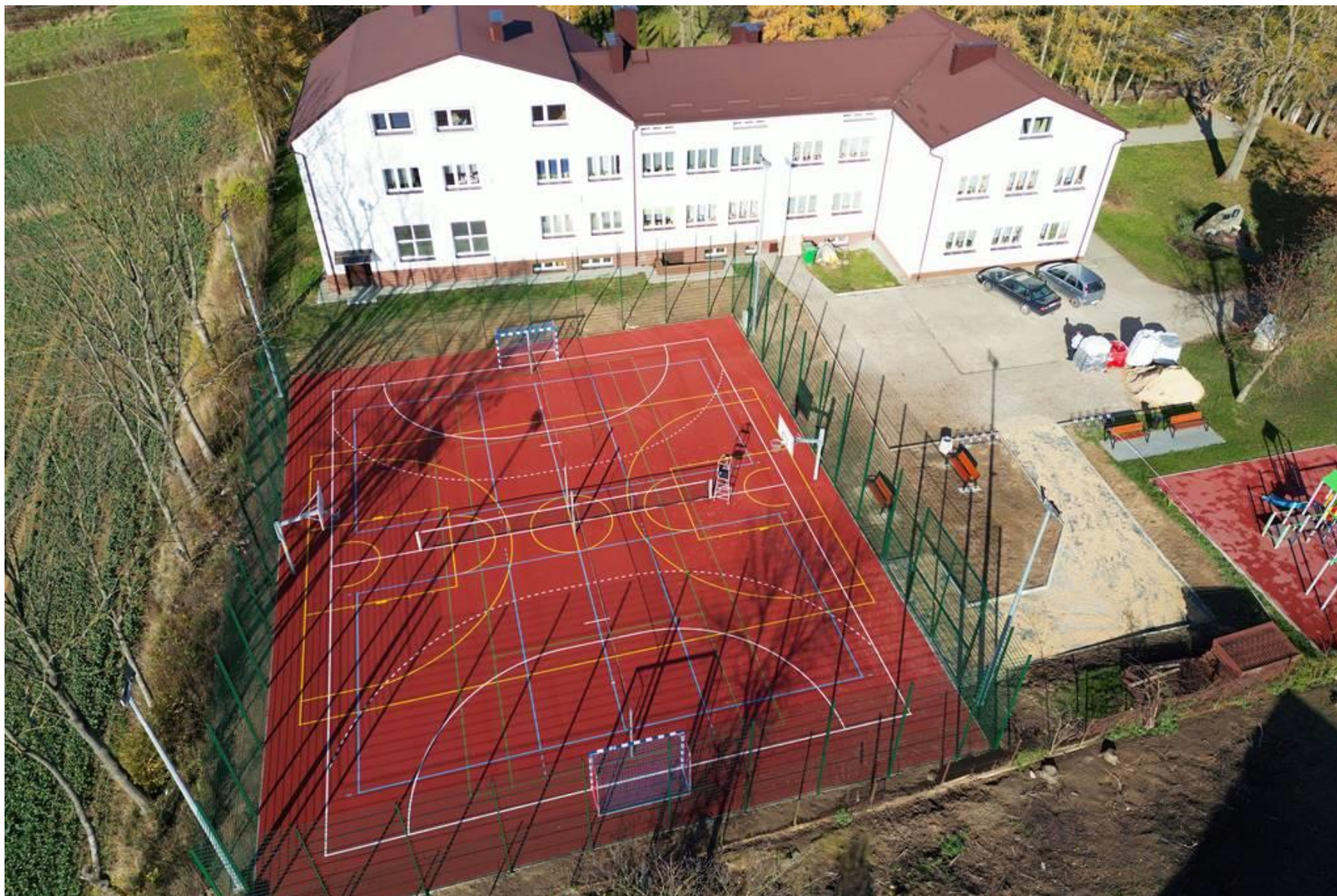
Budowa boiska wielofunkcyjnego przy Szkole Podstawowej w Zaburzu