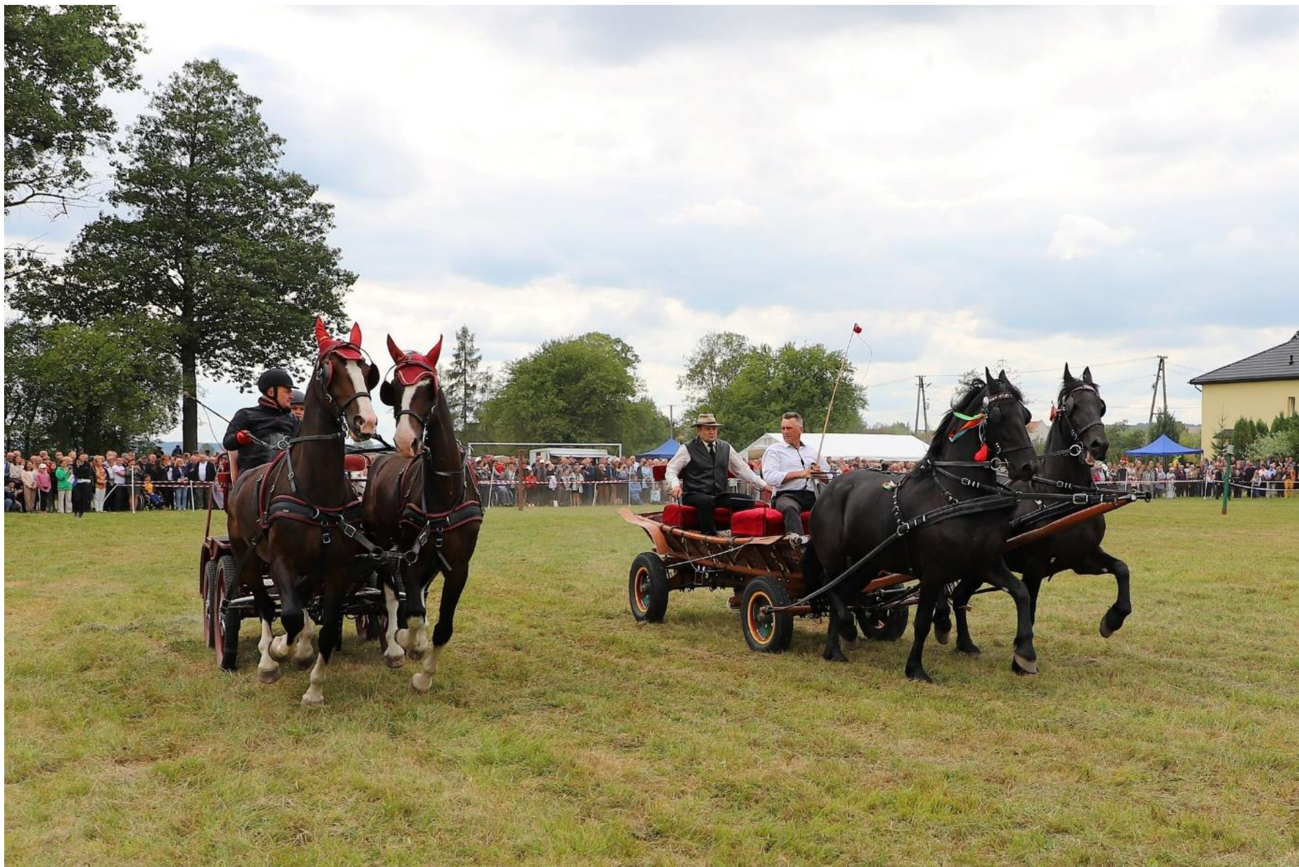
Zlot Zaprzęgów Konnych w Gorajcu-Zagroble