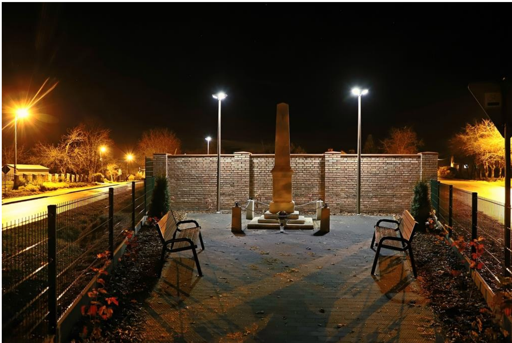
Obelisk zgody komasacyjnej przy siłowni plenerowej w Zaburzu