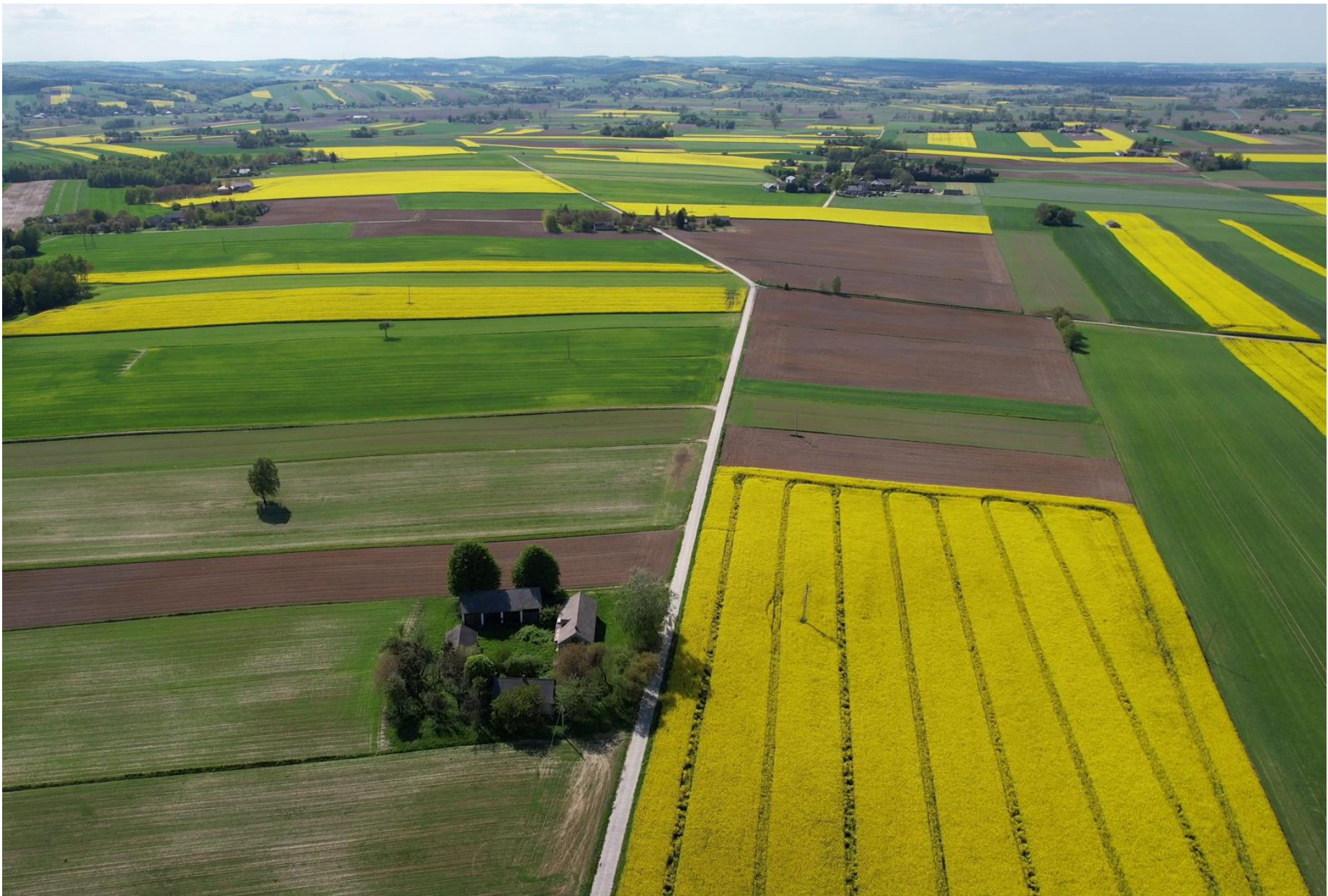
Modernizacja drogi dojazdowej do gruntów rolnych w miejscowości Zakłodzie