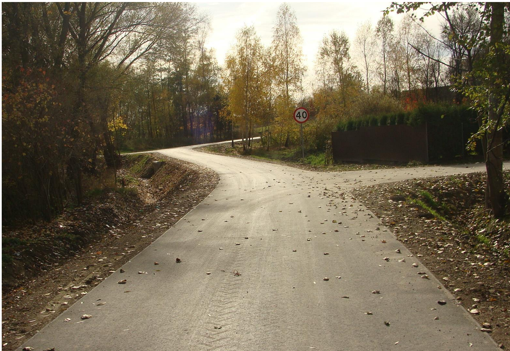
Budowa drogi gminnej Nr 110103L od km 0+002,5 do km 0+964,74 w miejscowości Latyczyn