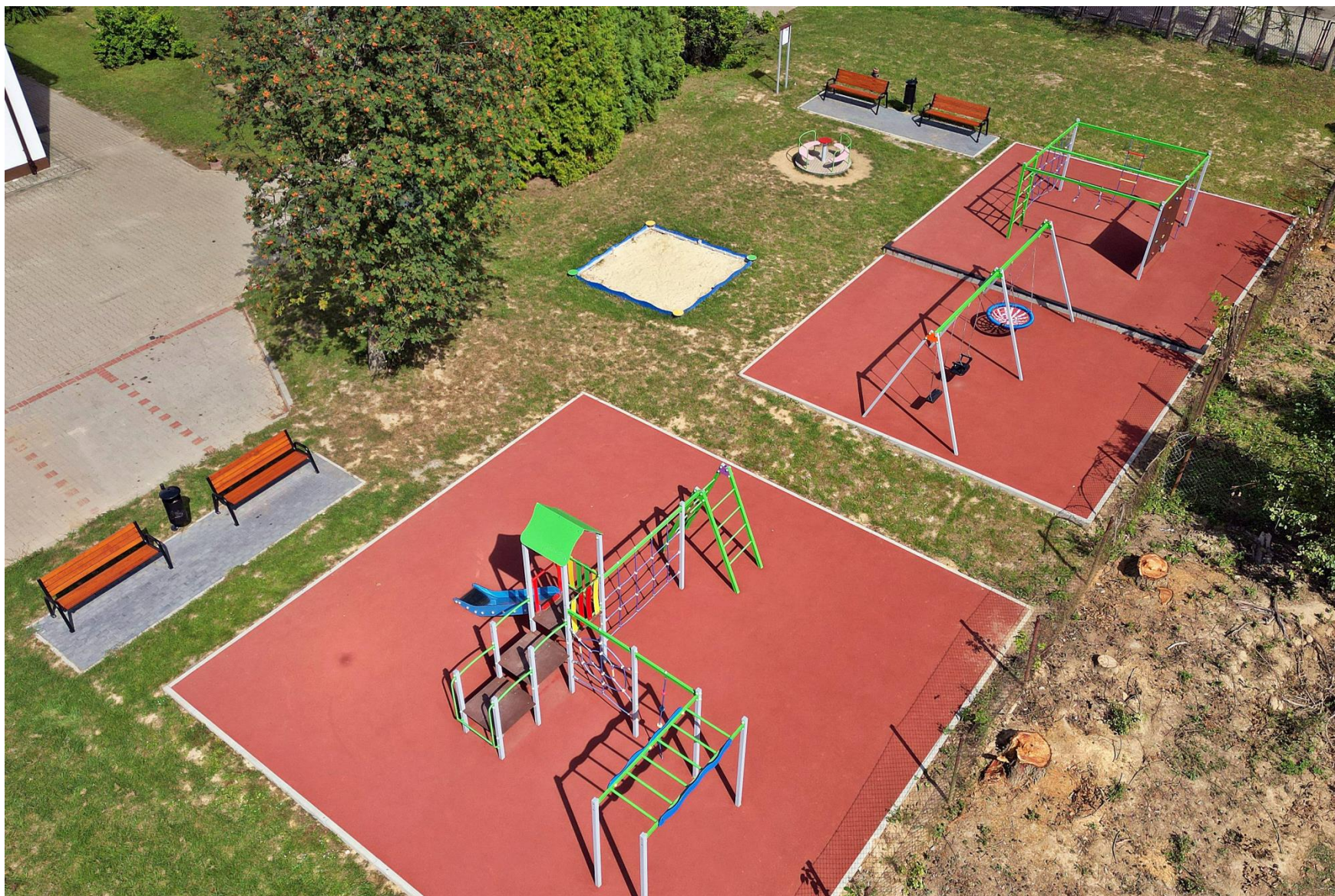
Plac zabaw dla dzieci przy Szkole Podstawowej w Zaburzu