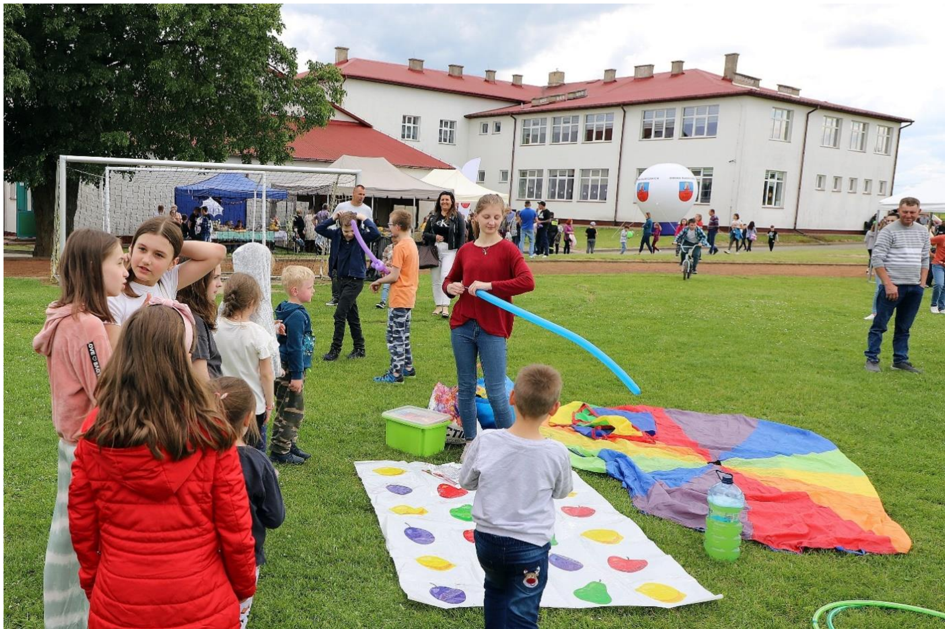
Gminny Dzień Dziecka w Gorajcu