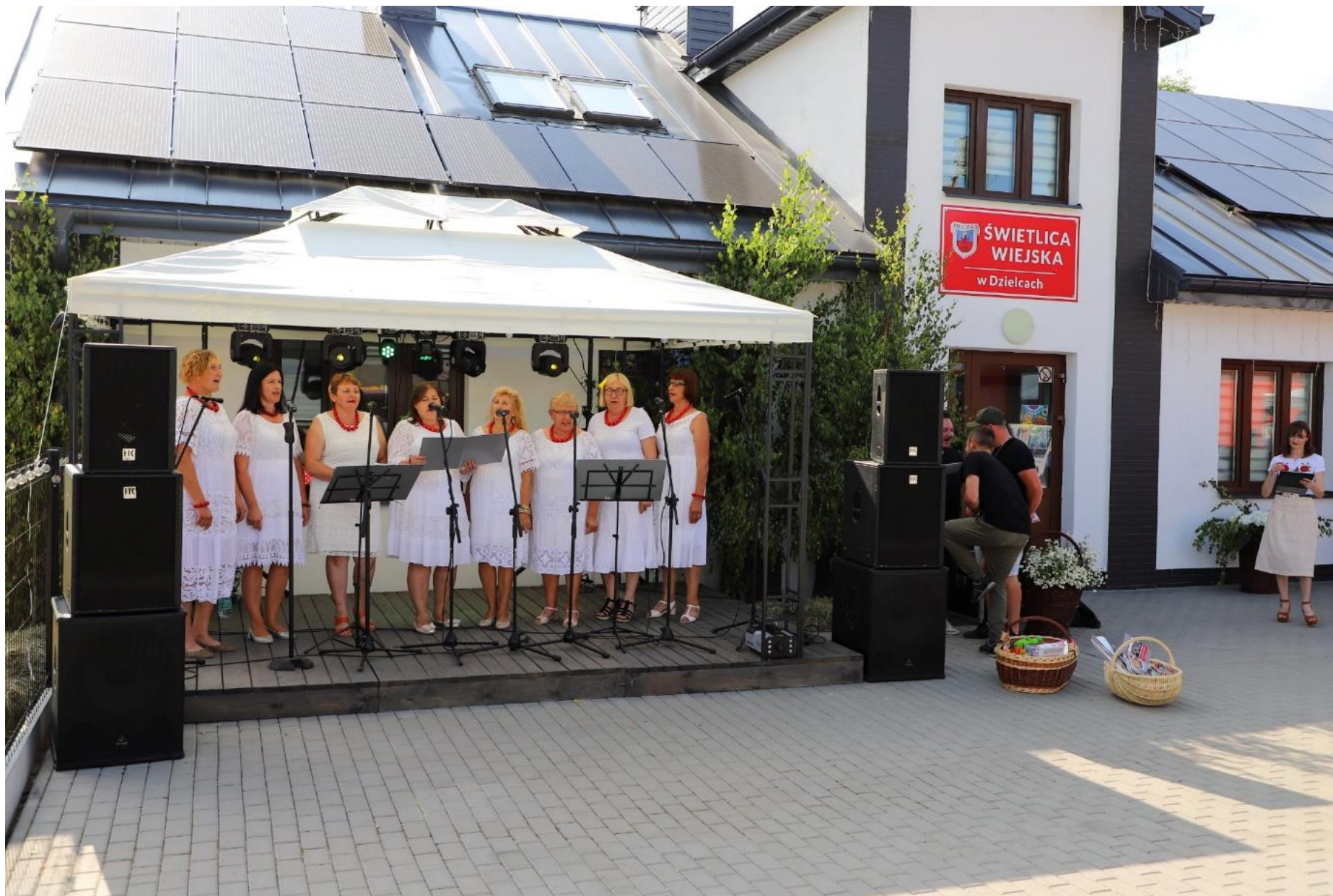
W „Dzieleckiej Dolinie” w Dzielecach