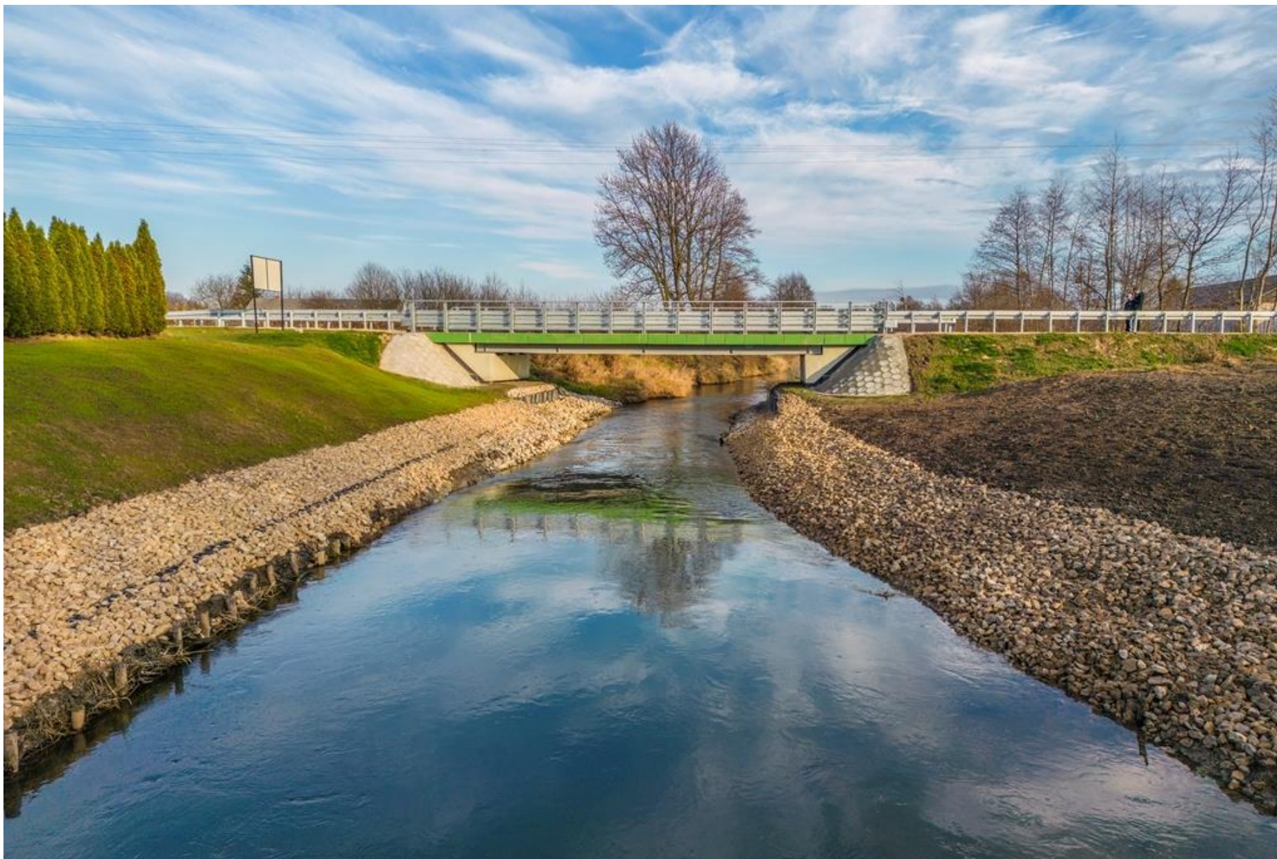
Modernizacja 2 mostów na rzece Por w miejscowości Zakłodzie