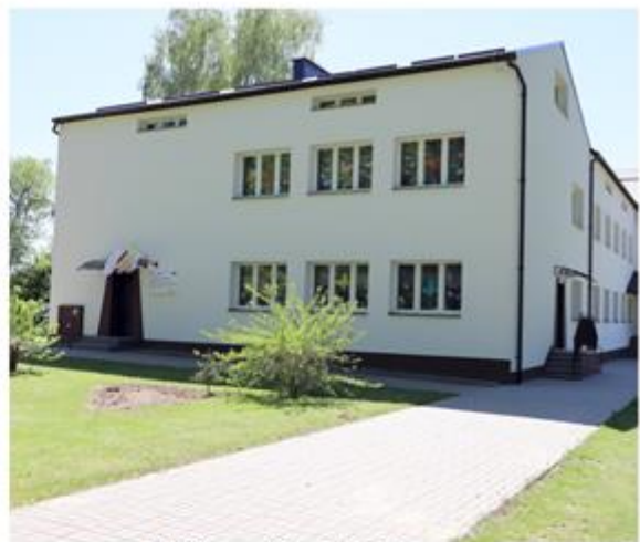
Publiczna Szkoła Podstawowa im. Jana Pawła II w Zaburzu