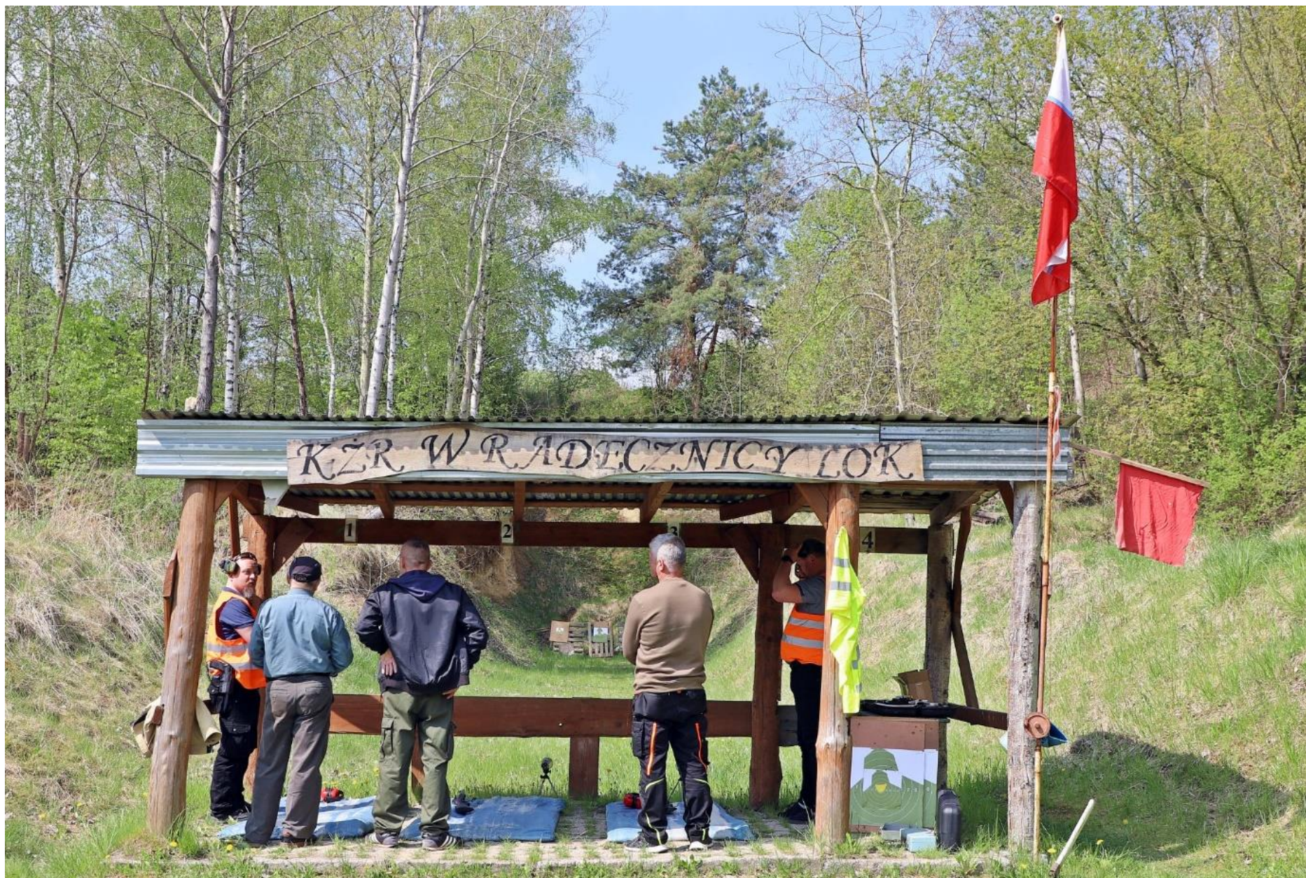
Zawody strzeleckie w Radeczniczy