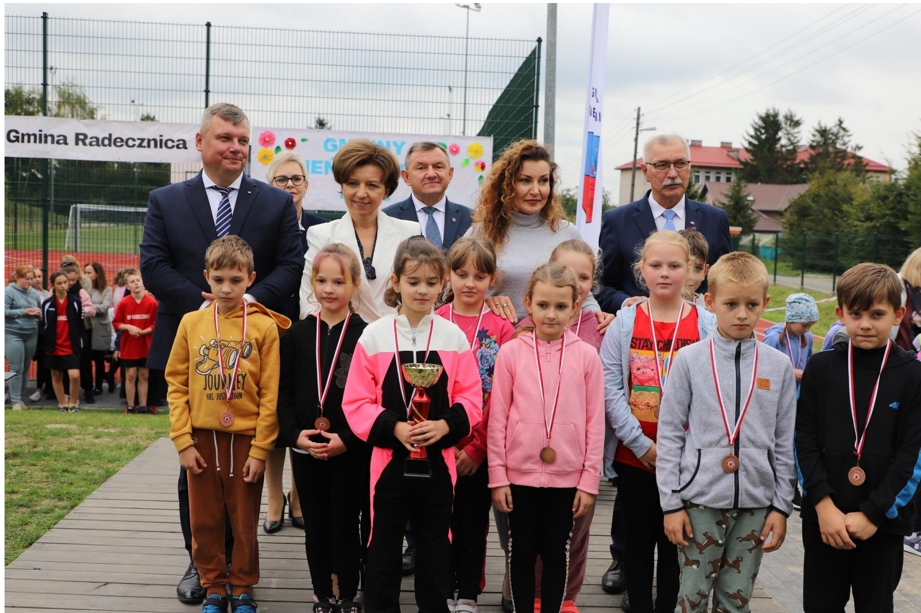
Gminny Dzień Sportu w Radecznicy