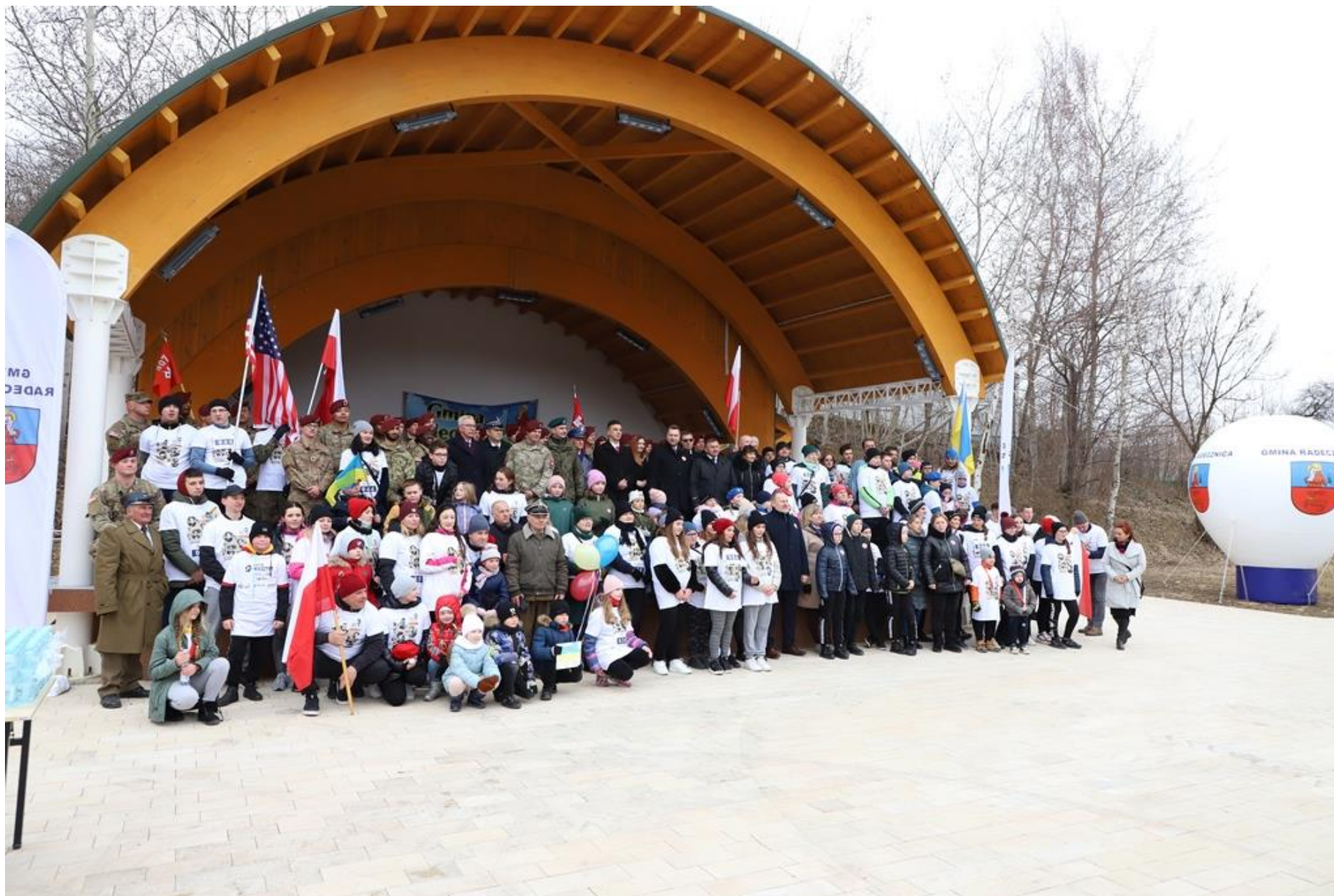
Bieg Tropem Wilczym