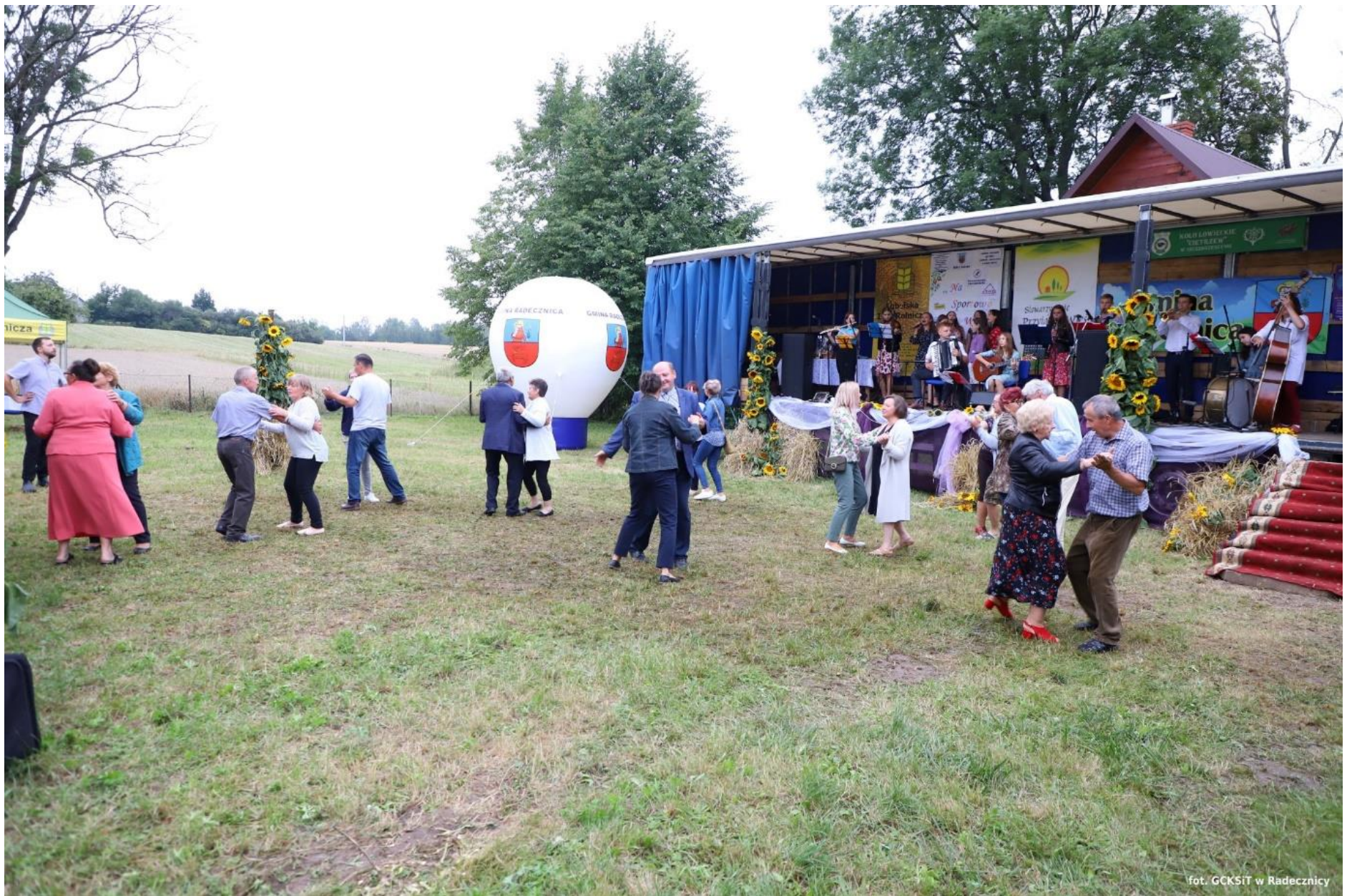
„Na Sportowo i Wesolo” w Zakłodziu