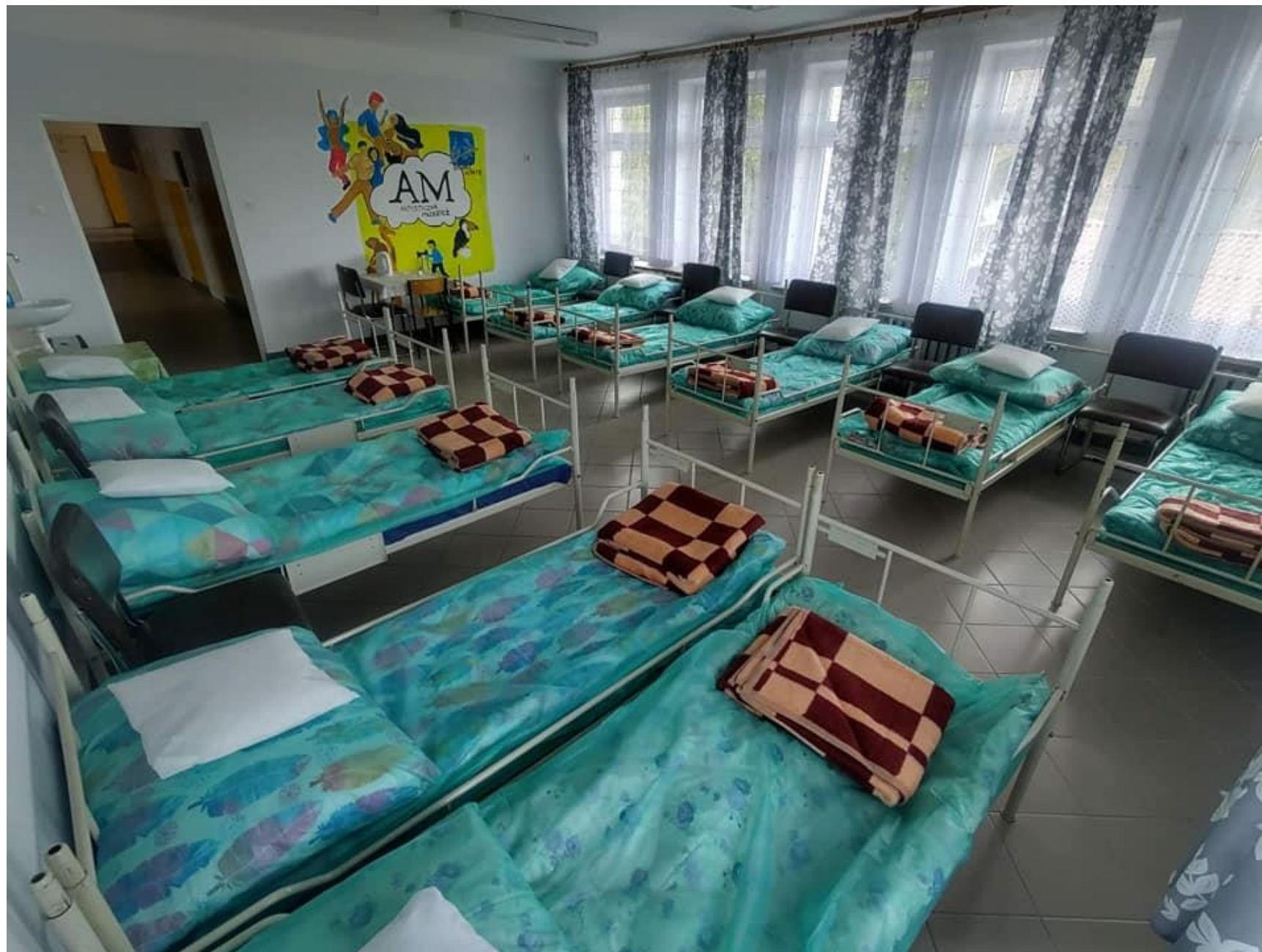
Punkt zakwaterowania dla Uchodźców z Ukrainy przy ul. B. Prusa 65A w Radecznicy