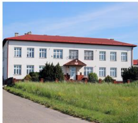
Publiczna Szkoła Podstawowa im. Kardynała Stefana Wyszyńskiego w Gorajcu