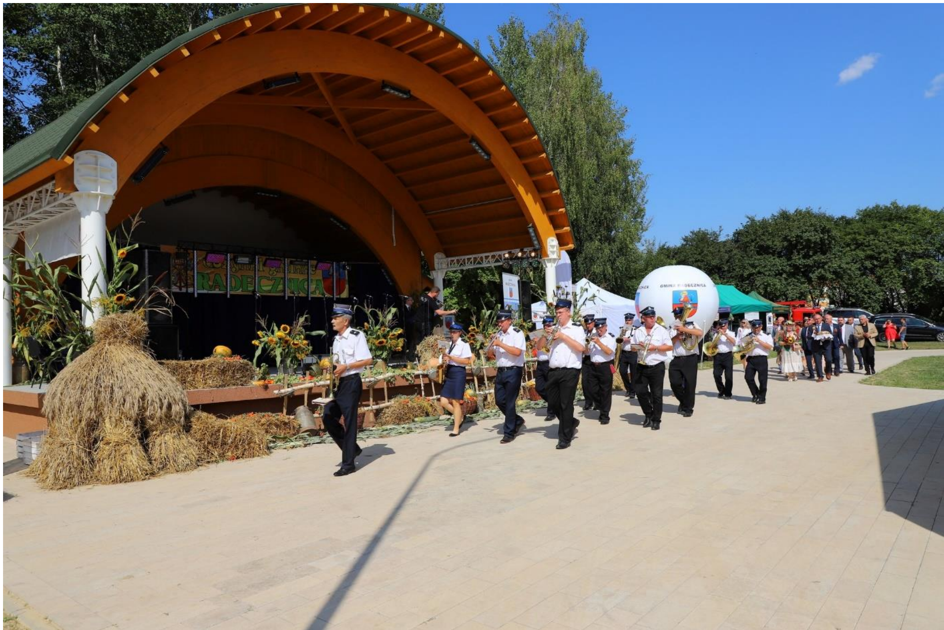
Dożynki Gminne w Radecznicy