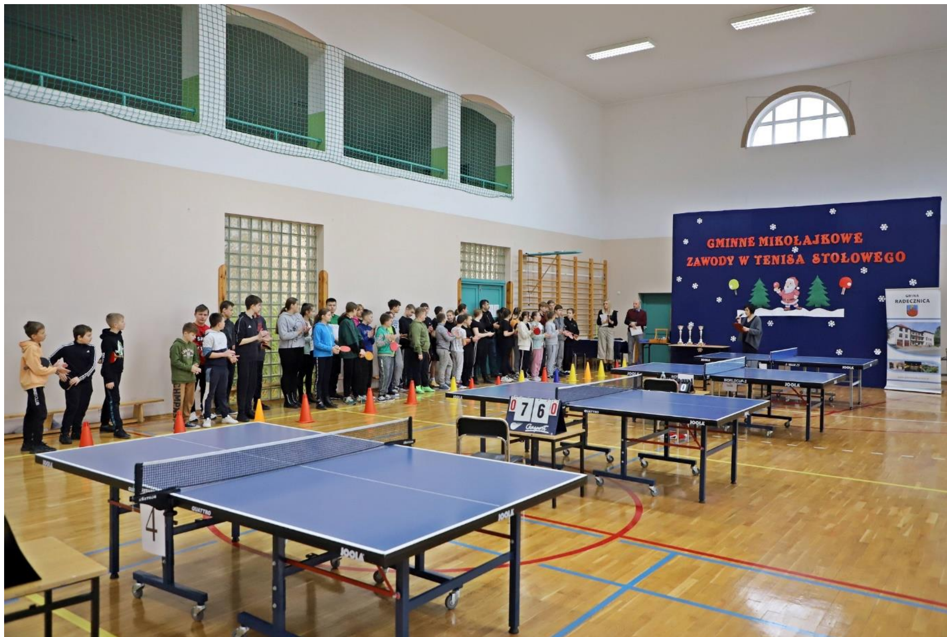
Gminne Mikołajkowe Zawody w Tenisa Stołowego w Gorajcu.