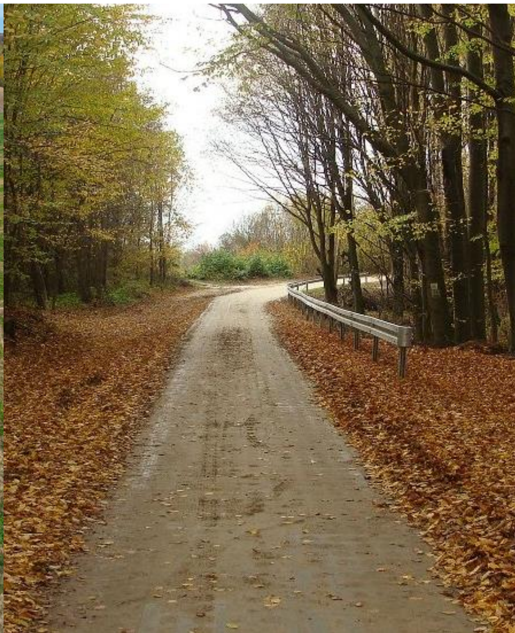
Budowa drogi gminnej Nr 116598L od km 0+000 do km 3+094 oraz drogi gminnej Nr 116150L od km 0+000 do km 0+642 w miejscowości Zaburze