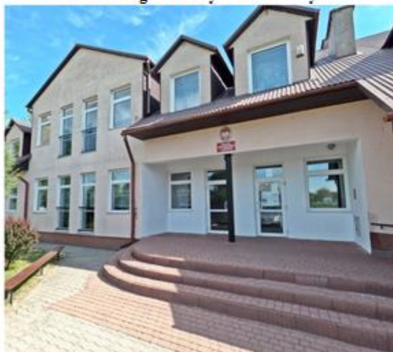
Publiczna Szkoła Podstawowa im. bł. ks. Zygmunta Pisarskiego w Czarnymstoku