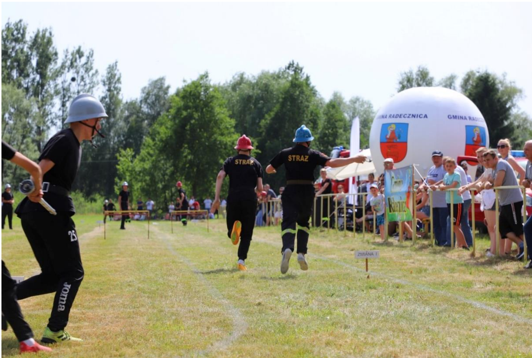
Zawody strażackie ratowniczo-gaśnicze w Gaju Gruszczańskim