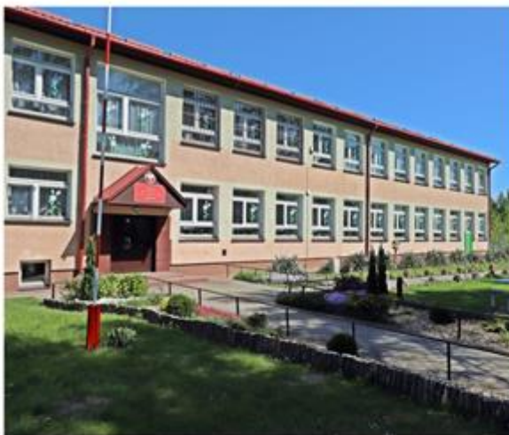
Publiczna Szkoła Podstawowa im. Św. Antoniego z Padwy w Radecznicy