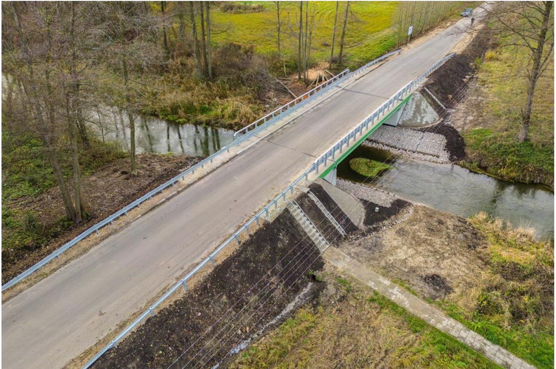
Modernizacja 2 mostów na rzece Por w miejscowości Zakłodzie