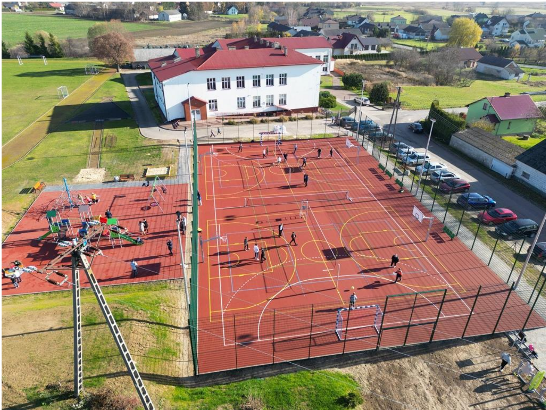
Budowa boiska wielofunkcyjnego, sprawnościowego placu zabaw i siłowni zewnętrznej przy Szkole Podstawowej w Gorajcu